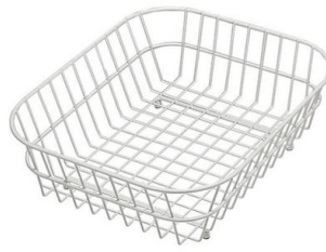
Cestello inox 8612 000