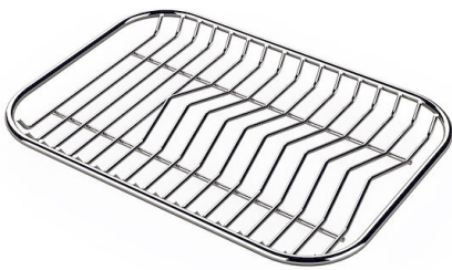
Griglia portapiatti inox 8100 154