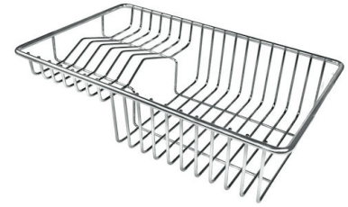
Cestello portapiatti inox 8100 303 * solo in abbinamento con l'accessorio 8644 101