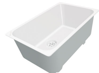
Vaschetta bianca 8153 100