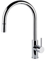
Miscelatore Camillo 8467 000