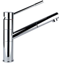
Miscelatore Lorenzo 8466 000