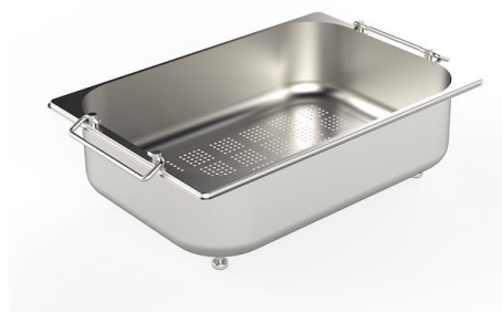
Scolapasta inox 8154 000