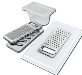
Kit grattugia con supporto per anello e vassoio di raccolta alimenti 8159 101 * solo in abbinamento con l'accessorio 8644 101